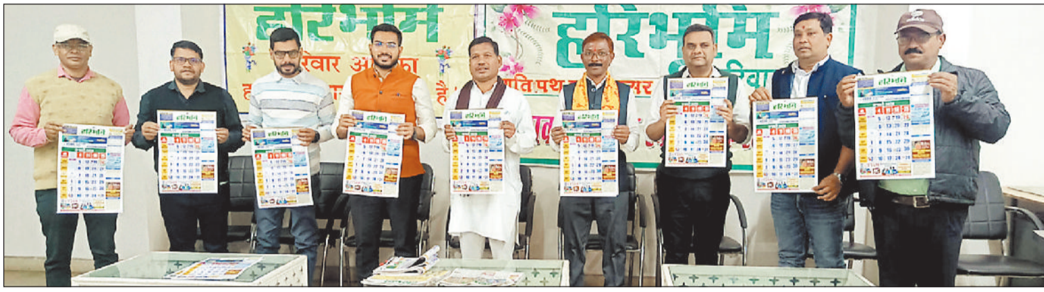
हरिभूमि कैलेंडर का विमोचन करते अतिथि।