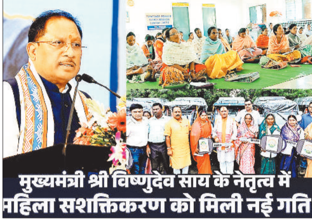
मुख्यमंत्री श्री विष्णुदेव साय के नेतृत्व में महिला सशक्तिकरण को मिली नई गति